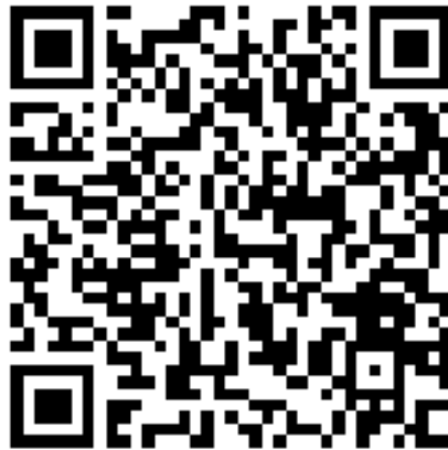
Tric a Chlic Songs